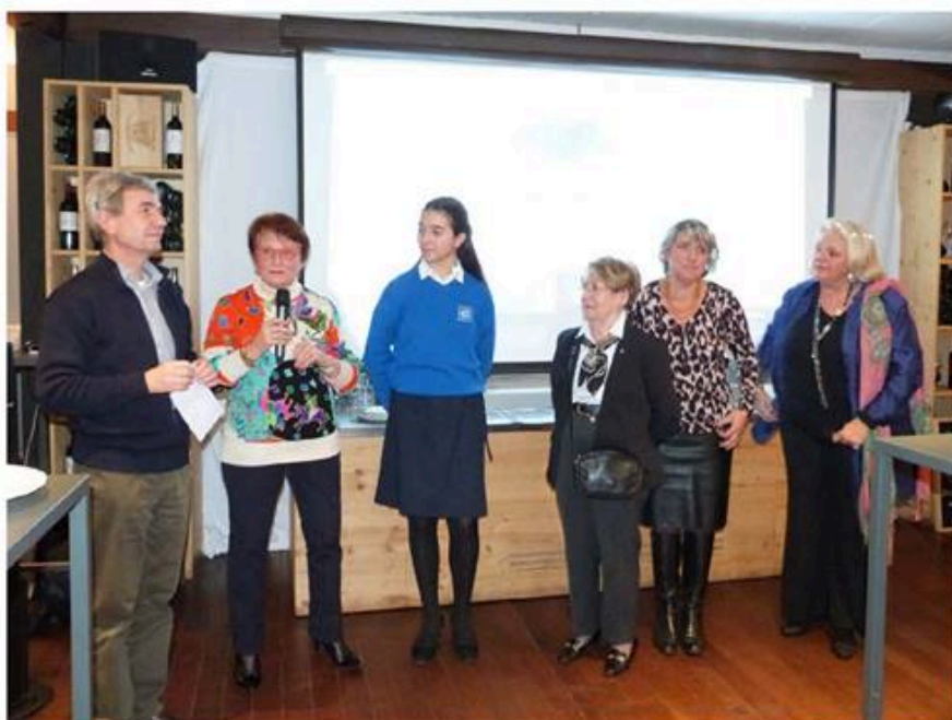
Remise d'un chèque pour les enfants hospitalisés en unité de cancérologie pédiatrique.