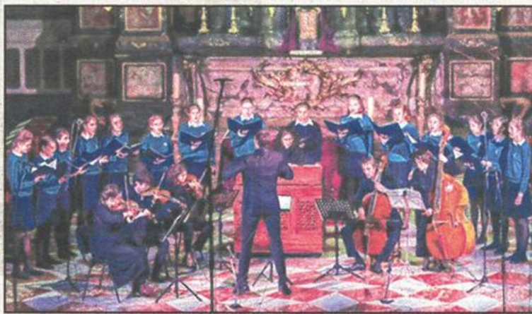
la Schola du Chœur des Filles de Bordeaux sera en concert à Libourne, à la chapelle de Condat.

Après avoir dirigé l'orchestre symphonique pendant deux ans, le Conservatoire lui confie le Grand Chœur en 2009. Il gagne le prix international de direction de chœur au Florilège Vocal de Tours avec « Le Chœur voyageur » qui obtient les trois premiers prix du concours national en mai 2009. Au programme du concert pro-